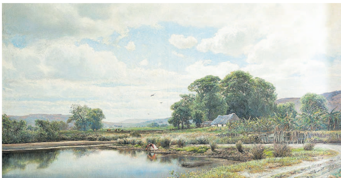
'Paisaje cubano'. Comprada directamente al artista a finales del siglo XIX, la puja por esta obra partirá de los 48.000 euros. Mide 114 por 195 centímetros.

pintura del espacio, Luis Pradillo. "Ya lo vendimos en el año 1985 a un coleccionista particular con el que ha permanecido desde entonces y ahora vuelve a nuestra casa", añadió.