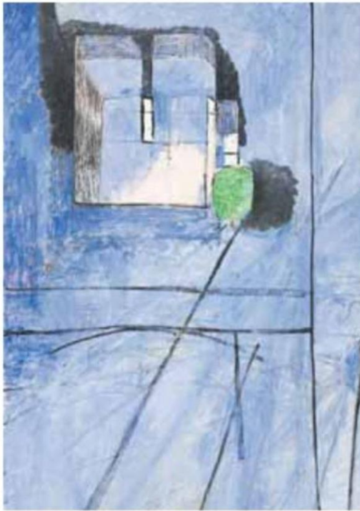
La porte de la Casbah (1914) y Notre Dame (1914), derecha, obras de Matisse | E.D.

tafísico italiano De Chirico que lo hizo Domínguez. El director del museo me dijo que lo habían des-catalogado y que ponía ahora en la cancela Domínguez a partir de De Chirico ".