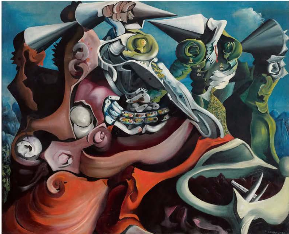
'La primavera' (1938), una de las obras de Óscar Domínguez que se exhiben en la exposición del Tenerife Espacio de las Artes.

Una exposición en Tenerife recrea la vida y la obra del torturado artista canario a partir de un centenar de obras