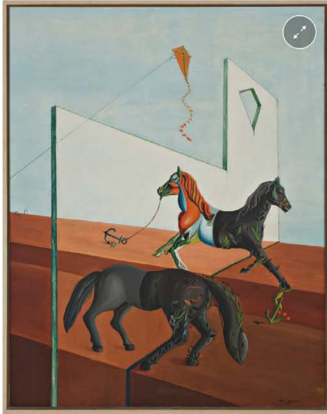
'Le dimanche' (1935). Colección Óscar Domínguez

objetos familiares se convierten en modelos de sus telas: el imperdible, el piano, el despertador, la cerradura o las latas de sardinas y abrelatas en L'ouvre-boîte (1936), Caja con piano y toro (1936), Femmes aux boîtes de sardines (1949) o Revólver (1952).