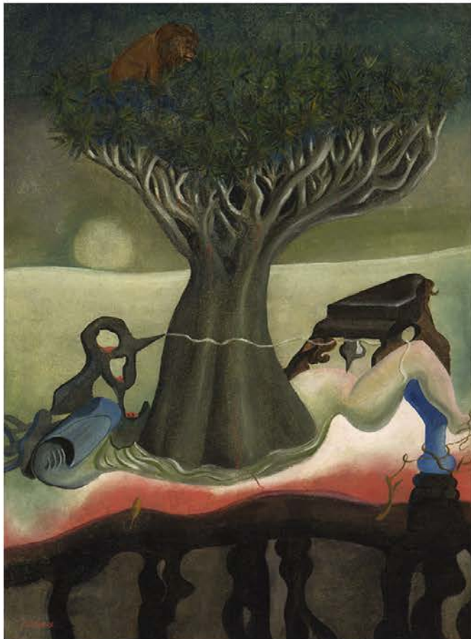
'El drago de Canarias' (1933). Colección Abanca.

El drago de Canarias (1933), prestado por la colección Abanca de A Coruña, es una de las piezas estrella de la exposición. No en vano llegó hace dos semanas al museo con una escolta policial similar a la de los grandes mandatarios. Pero al margen de la pompa que garantiza la seguridad de estas obras millonarias, los expertos equiparan al artista con el drago silvestre que sobrevive en el tiempo por los lugares en los que vivió el artista antes de abandonar su casa de Tacoronte y viajar a París en 1923 para ocuparse de los pujantes negocios familiares.