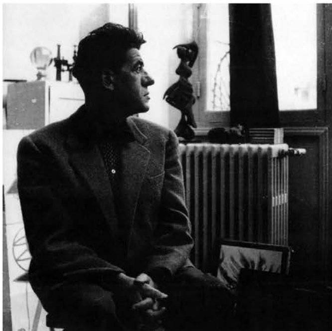
Una imagen de Óscar Domínguez sin datar.